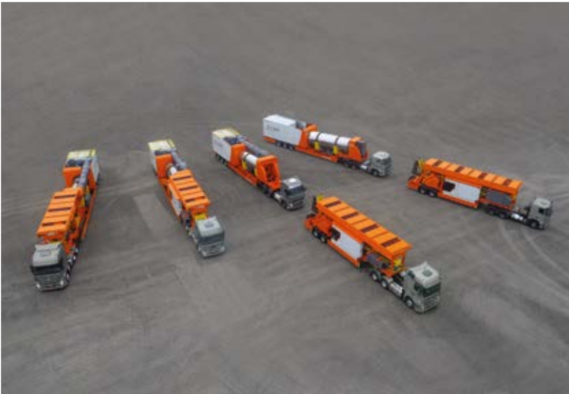
> Serie iNOVA de CIBER. Mayor capacidad de producción en solo uno o dos semirremolques y, por tanto, posibilidad de un transporte más sencillo.