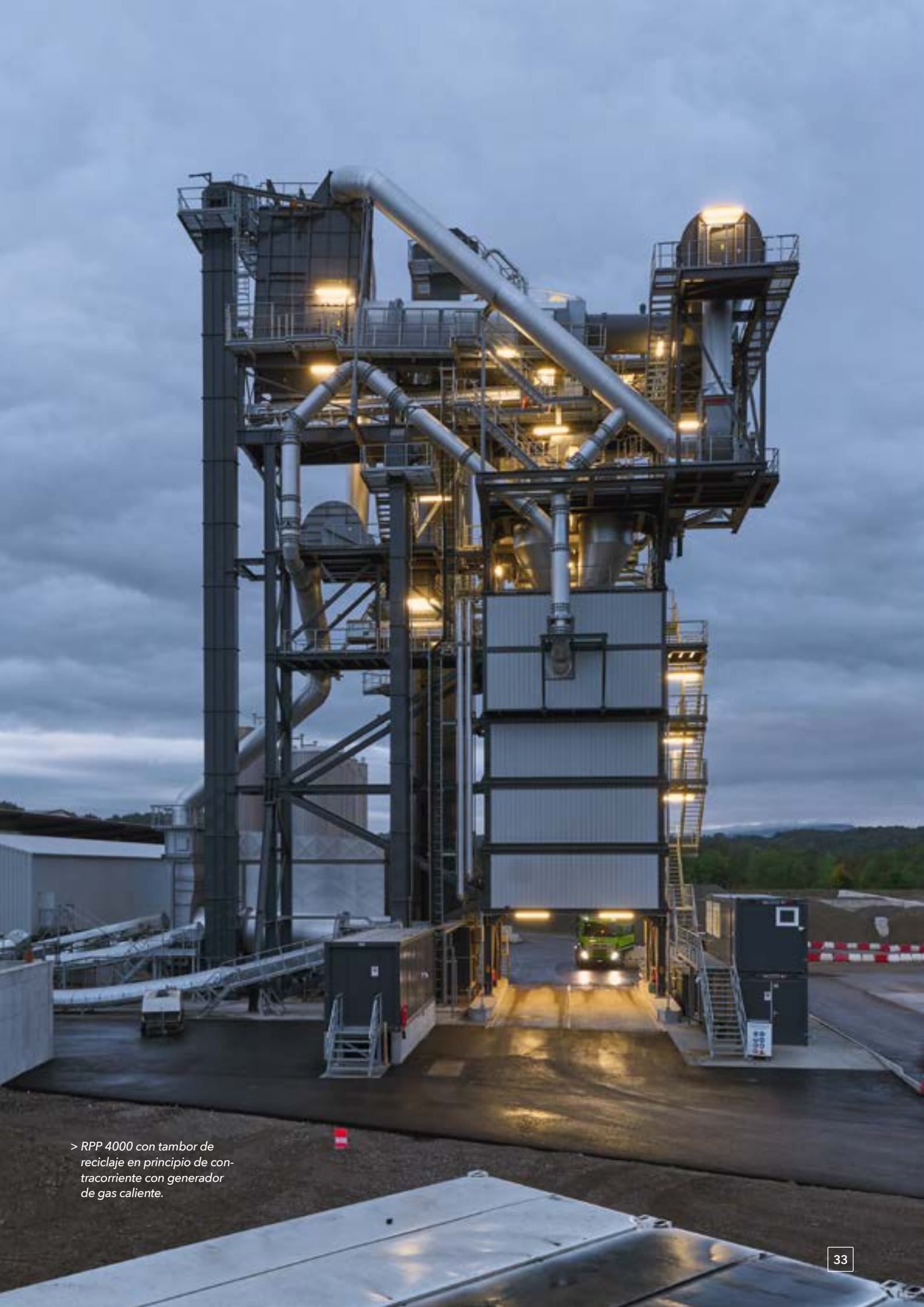
> RPP 4000 con tambor de reciclaje en principio de contracorriente con generador de gas caliente.