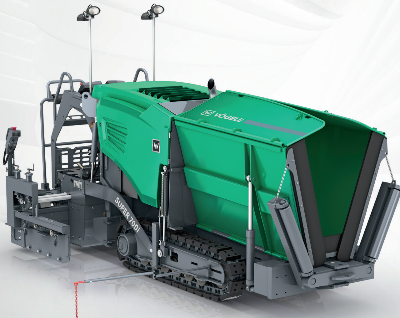
履带式摊铺机 超级 700(i) 小机型